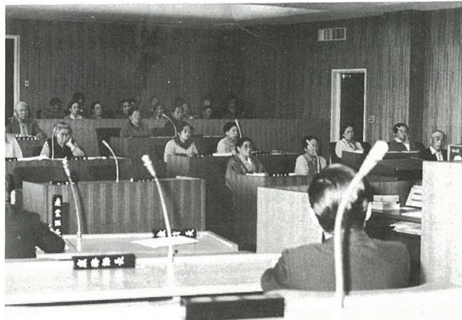
聞き入る老人大学生

この一年間、月に一度の老人大学が何よりも楽しみというお年寄りが多く、修了証書を感じ概深げに受け取っていました。