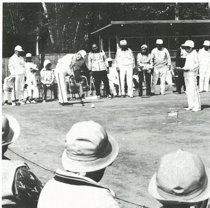
うまく通過できるかな？

行われ、また、各部落でもちょっとした広場でゲームを楽しんでおり、高度なテクニックも見られるようになりました。