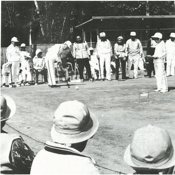
うまく通過できるかな？

行われ、また、各部落でもちょっとした広場でゲームを楽しんでおり、高度なテクニックも見られるようになりました。