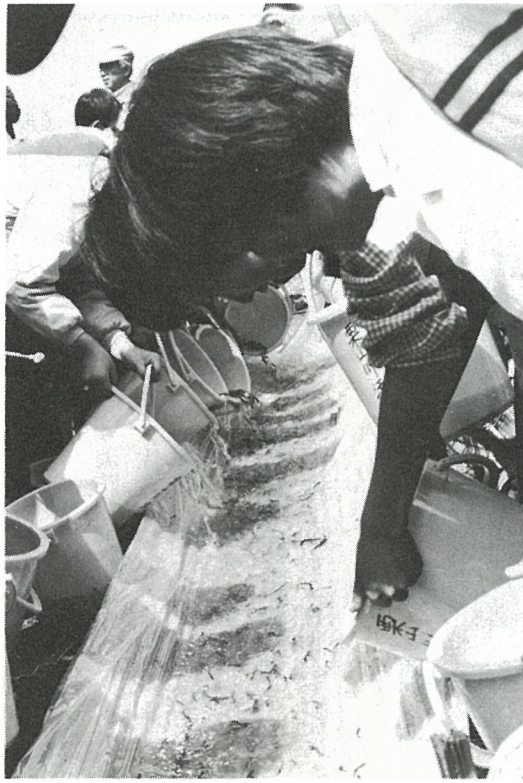
放流を行う白浜小六年生(学年は三月現在)

この日放流された稚魚は八十 五万尾(栗山川産含む)体長は 五〜十cm前後の稚魚を放流。 放流された稚魚は、一〜二ヶ 月ぐらいは河口部や沿岸で生活 し、五〜六月ごろ水温が十五度 前後になると冷たい北の海へと