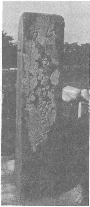
▶ 小田部台地の道標

る明治十二年、新井の稲荷神社前にある明治十三年、市野原の明治三十四年のもの、大正三年に日吉村の青年団が各分団毎に