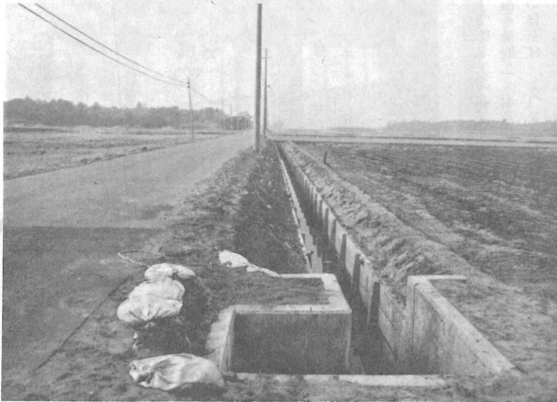
何でも作れる ▲ 水田へ整備された排水路 整備前 ▶

予測しがたい歳出予算の不足を補うために認められた制度であり、今年度は一千万円計上しています。