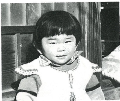
ただいまわんぱく盛り