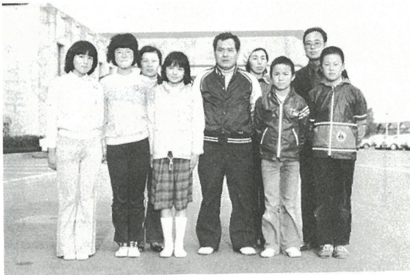
歳末助け合い募金を届けてくれた木戸子ども会のみなさん。