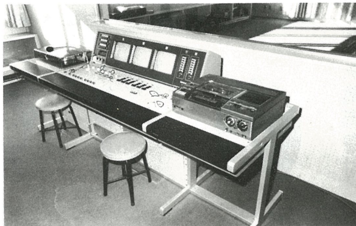
新装なった東陽小放送室の近代的設備 (教育費)