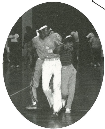
むずかしい トライアングルボールリレー