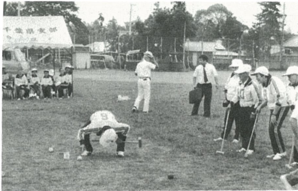
ハテ、どうやってくぐらせようか

会場では、運動服に身を固めたお年寄りたちが、あちらこちらに輪になって、味方チームを