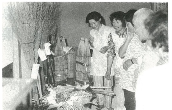
まあ珍しいものばかり