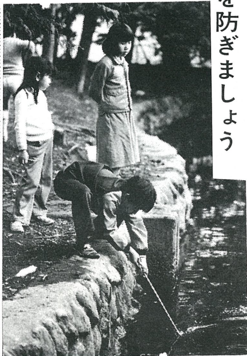
水辺の遊びは危険がいっぱい