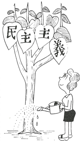
—この木を生かす代表を—

当選人を予想する人気投票の途中経過や結果について、公表することは全国的に禁じられています。