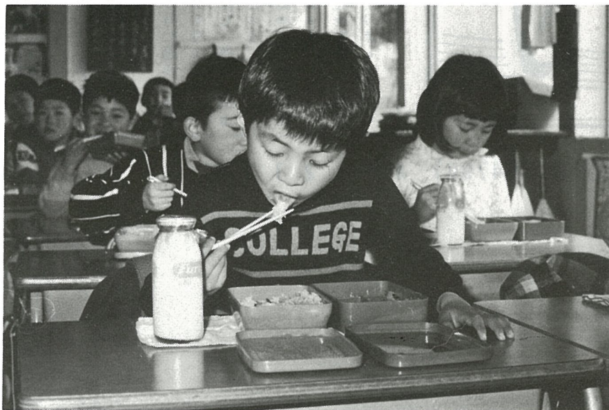
好評の米飯給食（南条小学校）

一、九八〇年代、農業の大きな課題は、米の過剰問題にどう立ちむかうか——。現在、米の過剰を反映して農家のみなさんは、減反のやむなきにいたっておりますが米の需給関係を正常化することは最大の急務です。このため、水田利用再編対策（当町の昭和五十五年度転作目標は一四〇・四ha）と並行して、県においても消費拡大が強力に進められております。 米は完全自給している大切なカロリー源であるとともに、すぐれたタンパク源として長い歴史の中で日本人の食・文化をつくり上げて来ました。そこで、食生活の多様化などにより米の消費量が減っているなかで主食としての米について考えてみましょう。