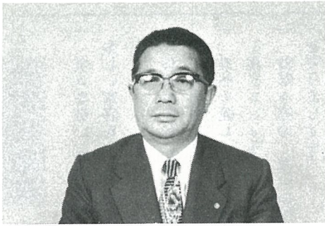
80年代へ意欲をもやす馬場町長