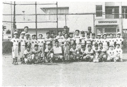
優勝した白浜スポーツ少年団

第十一回町内少年野球大会は、七月二十三日、町営グラウンドに於て各小学校単位のスポーツ少年団員一七八名の参加により盛大に行われました。 各チームのチビッコ選手は、暑さに負けず、日頃の練習の成果を十分発揮し、楽しい夏休みの思い出となりました。