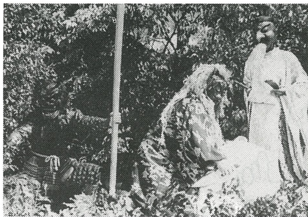
▶ 出演が決った「鬼来迎」