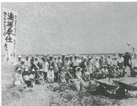
汗を流す老人たち