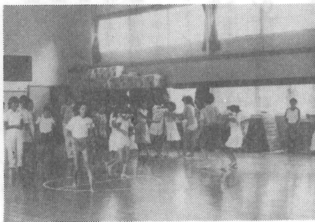
ゲーム中の少年少女