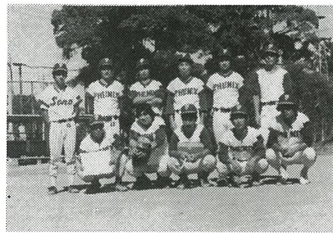
準優勝 二又フェニックスチーム