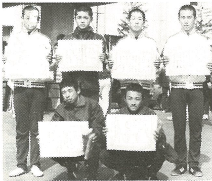
中学校野球部Aチーム

広報室では、みなさんからの投 稿を、お待ちしております。 町内のニュース、町への希望等 ささいなことでも結構ですので、 どしどし投稿してください。 有線での連絡は、二一四—〇一 へおねがいします。