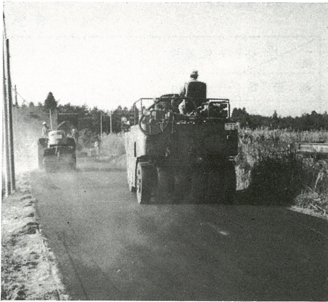
(道路新設改良費 173,413千円)