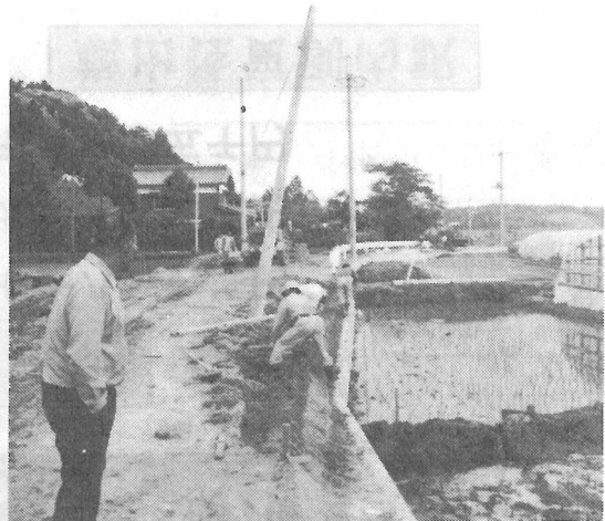
(二又・市野原線の改良工事)

51年度の道路整備計画は左表のとおりであるが、特に本年度は臨時市町村道整備債85,000千円をベースとして道路新設改良費 149,163千円を予算計上したので、町内の主要幹線道路の舗装工事は、ほぼ完了する見込である。