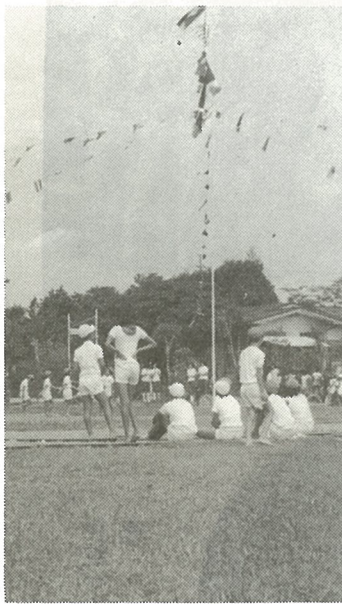
開校百年記念大運動会