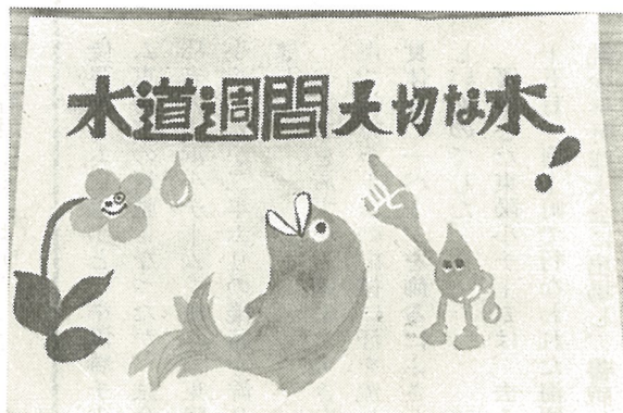
図画 布施尚紀君(南条小五年)と 作品