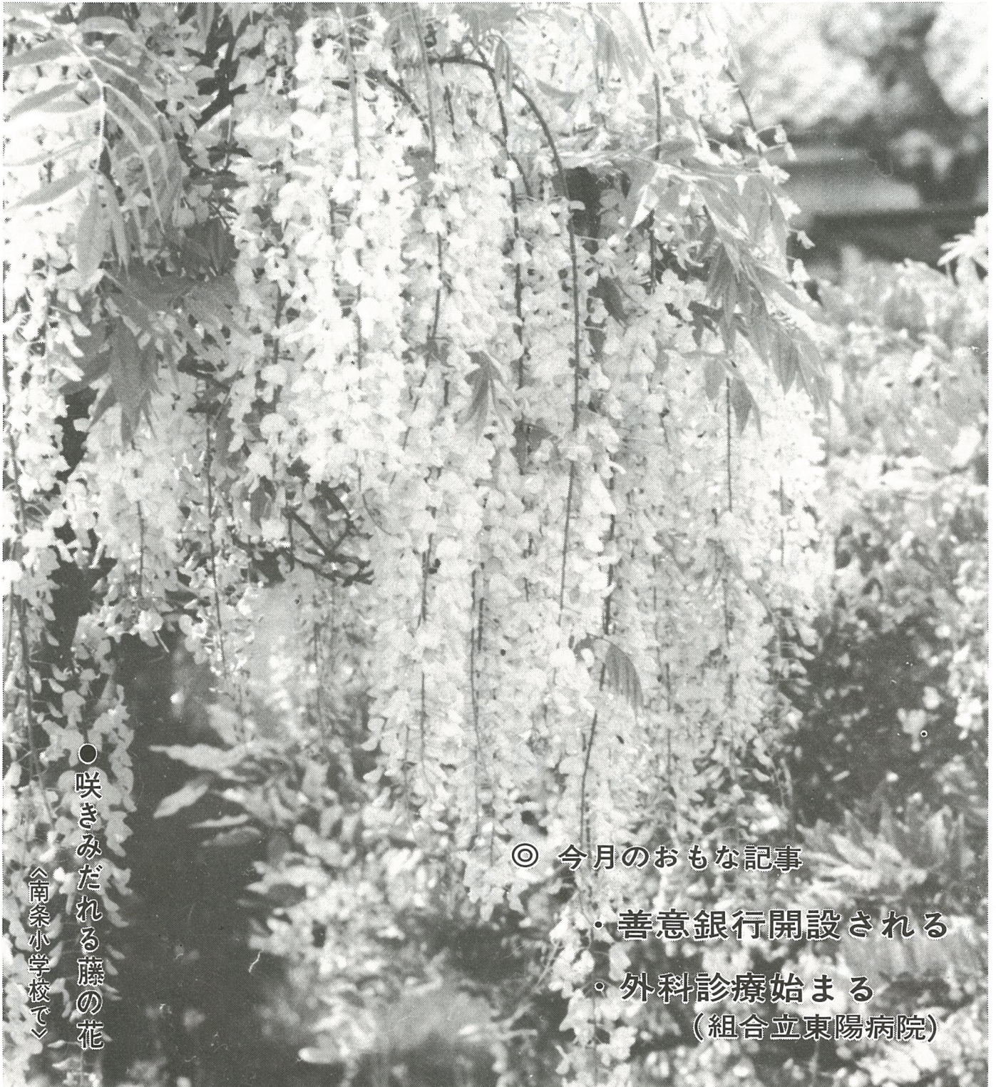
● 咲きみだれる藤の花 〈南条小学校で〉