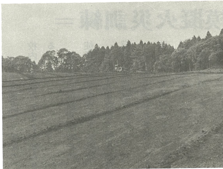
(区画整理が行なわれている小川台)

昭和五十年の新春をむかえ、昭和の歴史の深さと国運の隆盛を心からことぶき奉りましょう。 当町も合併二十一周年をかぞえ日進月歩の発展を続け、まことにご同慶のいたりであります。 ことしは町の象徴でもあります新庁舎も竣工いたしましたので、いよいよ信頼を高めた行政を推進いたします所存であります。