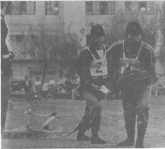
(一つのホースを握る手に厳しさがにじむ消防団員)

七月十八日、光中グラウンドに 激しい掛け声が響く。そのたびに 消防団員の動作が機械に動く。火 災を消しとめるため技を競う消防 団員たちも必死。また人命を守る ための大会なのでどの顔も真剣で すさまじい迫力である。 町のポンプ操法大会が行なわれ 結果は次のとおりでした。 〔自動車部〕 ・優勝 第七分団第三部(関) ・二位 第五分団第一部(古屋) ・三位 中央分団第一部(橋場) 〔可搬の部〕 ・優勝 第七分団第四部(白磯) ・二位 第七分団第一部(長塚) ・三位 第八分団第一部(尾垂) 〔手引の部〕 ・優勝 第一分団第二部(二区) ・二位 第六分団第一部(作間内)