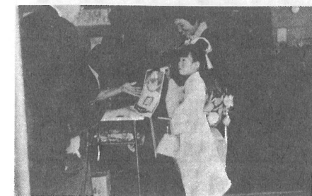
(小さな手に千歳あめをもらって)

赤い晴れ着に 帯しめて 合同七五三祝 うれしい七五三 「あかいはれぎにおびしめて おみやまいりにいきましょう おててつないでかあさんも ほんとうにうれしい七五三 十一月十五日、光中学校体育館で、町の合同七五三祝が行なわれました。午前九時半から受付が行なわれ、おとうさん、おかあさんに手を引かれた男・女児童一六〇