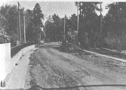
(上) クイ打ち工事が始まった中央公民館