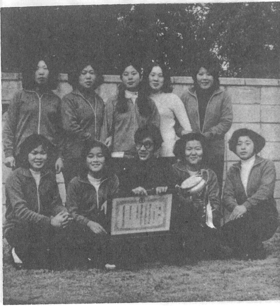
優勝杯を手にニコリ (実川メリヤスチーム)