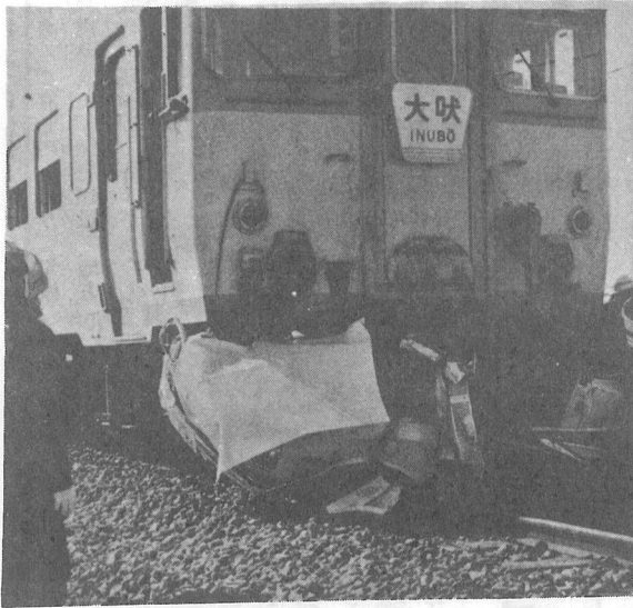
(昨年12月の126号線バイパス母子地先踏切事故)

冬の交通事故防止運動が十二月十一日から今年一月十日までの一ヶ月間行なわれます。 ○飲酒運転を追放しよう この時期は、季節柄飲酒運転が急増すると思います。 「一杯だけ」と軽い気持ちで飲んでも運転をはじめると車内の温度があがり、車の振動も加えて酔いがまわりとりかえしのつかない事故を起こしてしまうのです。