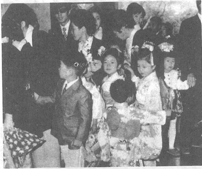
すてきだね……。きれいなおべへ