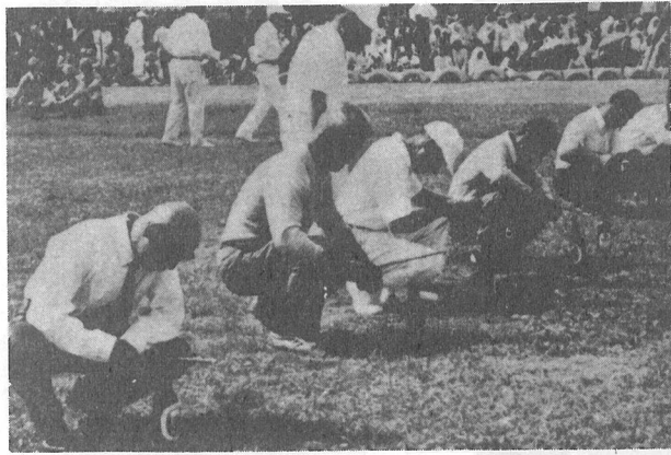
↑ 飲むは早い、釣るのはおそい？……