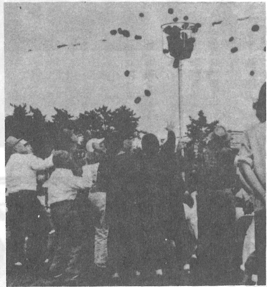
↑ 足腰のばして ソレはいれ！