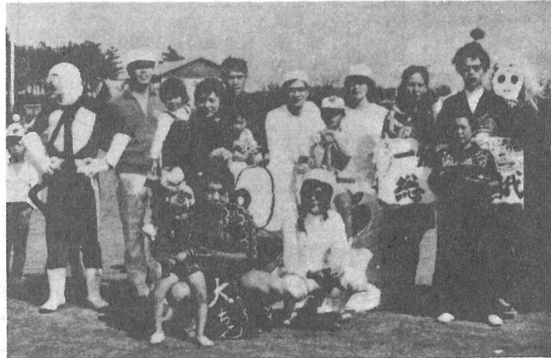
ちびっ子の人気をあつめてみごと優勝 (役場チーム) ←