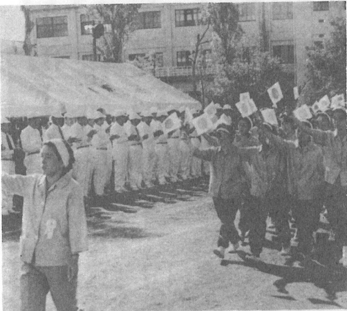
写真上 いつも人気を呼ぶ仮装行列 下 小旗を手に堂々入場の婦人会 (写真はいずれも45年の体育祭から)