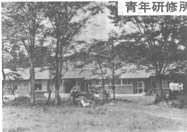
—緑に囲まれた静かな協同館—

町では昭和四十六年度事業をもって青年研修所の建物を取りこわし、そのあとに工事費千三百三十万円をかけて新しく農村協同館を建設してきましたが、去る四月十一日に完成いたしました。 この協同館は、農村社会生活の変化に伴い農家経営の向上安定をはかるため農家婦人、農村青少年の研修活動の場として建てられたものです。 また、一般の方々にも結婚式、会議など公民館的な性格としても広く利用していただく方針ですので、どしどしご利用下さい。