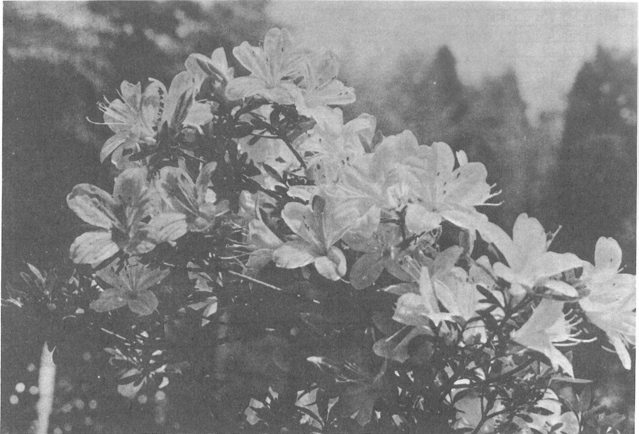
初夏の陽を浴びて

町の状況 人口 男 5,571人 女 5,848人 計 11,419人 世帯 2,575世帯 面積 33.40平方キロ