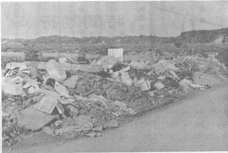
山のごみ放つ臭悪

去る三月定例町議会で皆さんの健康と生活を守り、住みよい公害のない光町をつくるため、公害防止条例が議会で可決され、四月二十日より適用されることになりました。