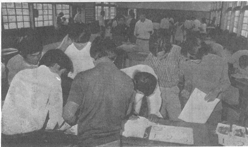
どれがいちばんいいのかな、慎重に判定する継友会のみなさん

総合点で上位十名（男五名、女五名）が選ばれ、千葉で行なわれた県大会に出場しました。