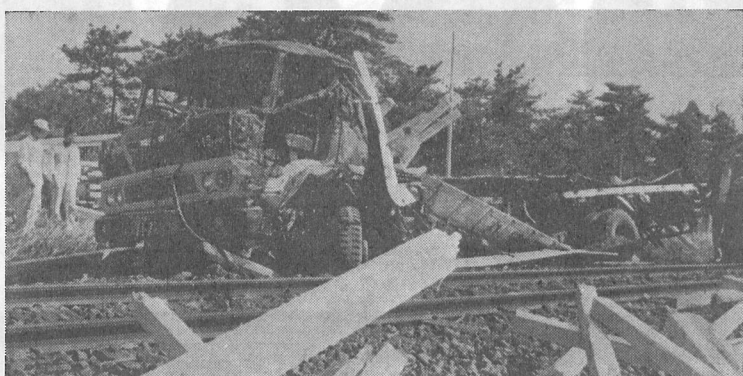
桑郷の踏切で貨物列車と衝突し、大破したトラック

舗装された路面が、非常にすべりやすくなっていますので、いつもなら避けられる事故も避けられなくなりま