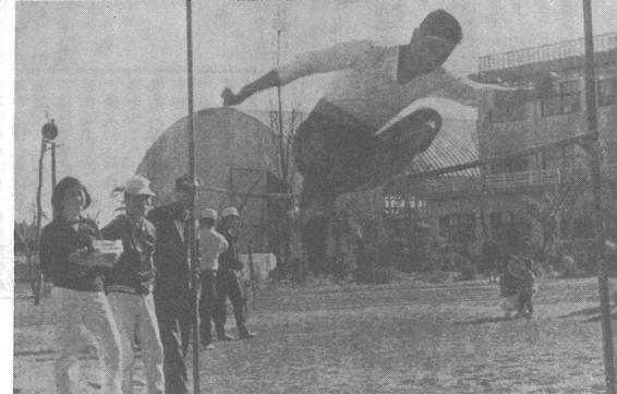
写真は(上)力強い宣誓 (下)「みこと」こと一言につきるすばらしい跳躍

激しい 気合 日吉小学校で開かれた剣道競技には、日吉小学校の豆剣士五十名のほかに臨むためには、ひごろの練習の積みかさねが必要で、十名が、激しい気合のもとで、関係者を喜ばせてくれました。