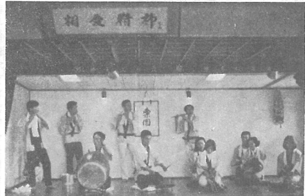
熱心に練習にはげむ三区の青年たち

「お体まで大切に今後共健康で御活躍くださいませようお願いします。」 「お体まで大切に今後共健康で御活躍くださいませようお願いします。」