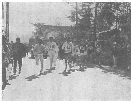
(一せいにスタートした11チームと町長)

町民の体力つくりと、青少年十二区間、一般八区間にわたる健全育成を目的にはじめられた町内駅伝の第二回大会は、体育協会の主催により関係各方面の協力を得て二月八日開催された。結果は、光中陸上チームが総合優勝し、新記録続出の大会となった。