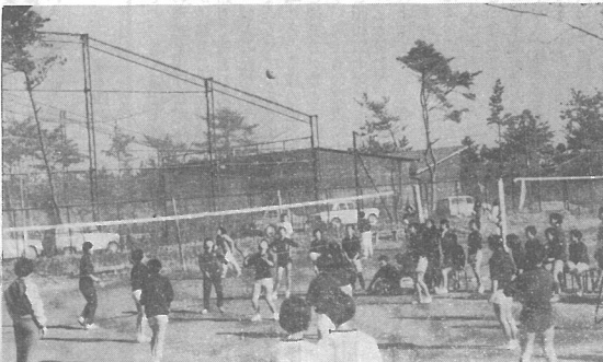
(バレーボール競技)

を第一回大会とし、今年中行事に回から、さらには多くの皆さんが参加することを望んでいます。なお各種目の結果は、次のとおりです。