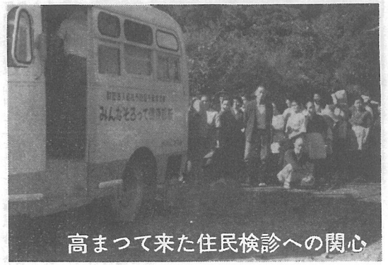
高まつて来た住民検診への関心