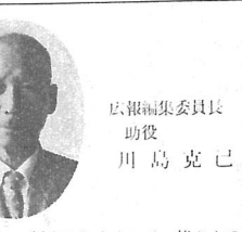
編集室を代表して