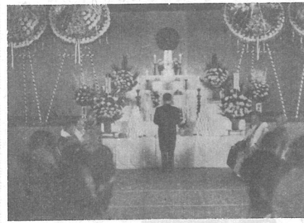
光町戦没者の合同慰霊祭執行。...