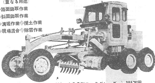
HA-4GS型モーターグレーダー 385万円。