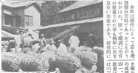
写真は産米出荷風景