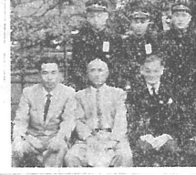
「一日の丸揚揚運動」光町代表と、皇居前広場保健会長、日米講和全権、一万田尚登氏との記念撮影。