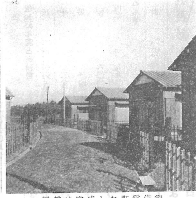
写真は完成した町管住宅

町管住宅桑郷団地完工 昭和三十三年度(第三期)は、希望に満ちた門出を成、直ちに入居者を決定新成、第一種四棟、第二種十棟、第二種十棟、新築文化住宅五棟を建設し、本年に入居出来る予定です。