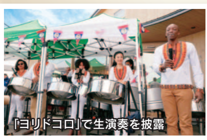
【ヨリドコロ】で生演奏を披露

11月15日から17日まで、ベリーズからスティールパンオーケストラ「パンテンプターズ」のメンバーが来日しました。 スティールパンとは、ドラム缶を切って作った音階のあるカリブの打楽器です。オーケストラのみなさんは、南条小や光中学校、ヨリドコロなどで演奏を披露しました。子どもたちは見たことのない楽器に驚きながらも、迫力ある音色に魅了されていました。 また、光中学校では、生徒たちが書道や剣道などを通して、日本文化の交流を行いました。 横芝光町は、東京2020オリンピック・パラリンピック競技大会のベリーズのホストタウンとして登録されています。今後も人的・経済的・文化的な相互交流を行っていく予定です。