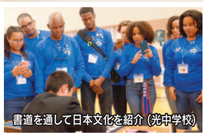
書道を通して日本文化を紹介(光中学校)