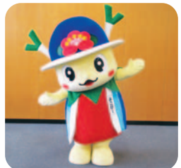
横芝光町マスコットキャラクター よこぴー

みなさん、応援ありがとうございました。これからも、町のPRのため、よこぴーは頑張ります。引き続き、応援よろしくをお願いします。