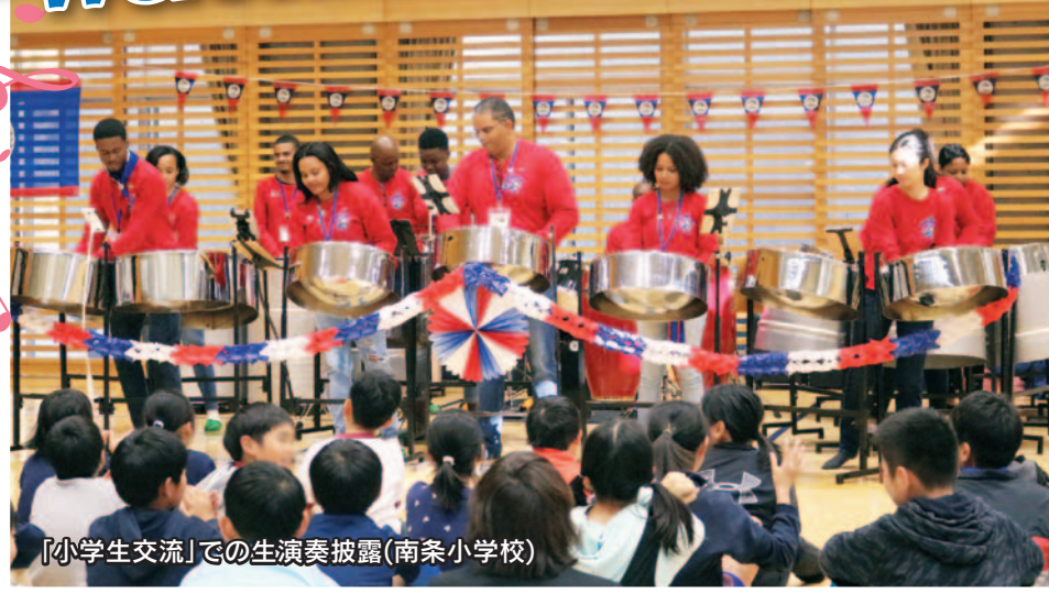
【小学生交流】での生演奏披露(南条小学校)