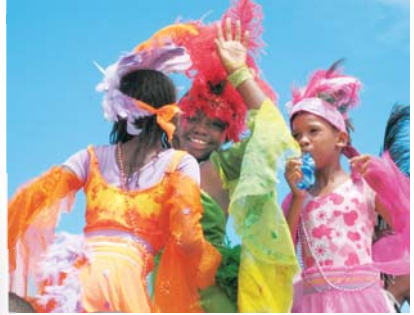
▲カーニバルに参加する子ども達