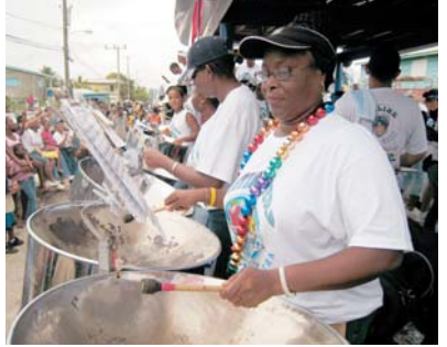
▲スチールパンオーケストラによる演奏パレード