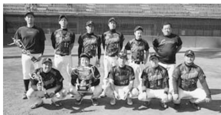
▲優勝したレジェンズのみなさん