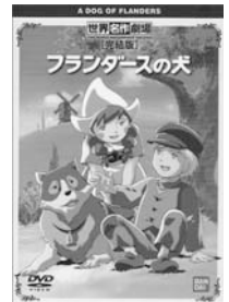
「フランダースの犬 完結版」