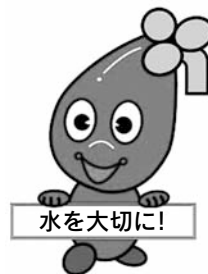
山武都市広域水道企業団 マスコットキャラクター 「さんすいちゃん」

直射日光を避けて涼しい場所に保管すれば、3日程度は消毒用の塩素の効果が持続します。