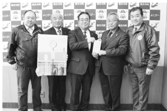
▶寄贈された時計塔