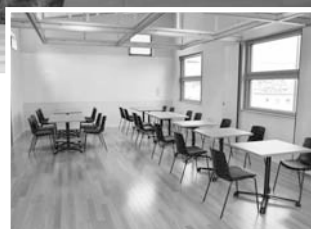
2階多目的スペース

施設設備 待合・情報ラウンジ、多目的スペース、多目的トイレ、売店、レンタサイクル、無料wi-fi、乗合タクシーオペレーションセンター