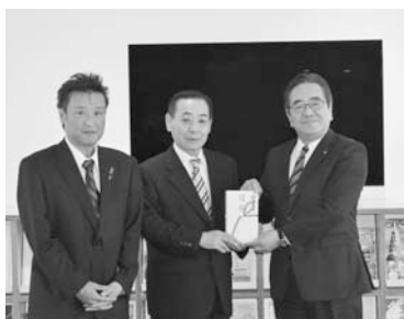
▲寄贈されたテレビ