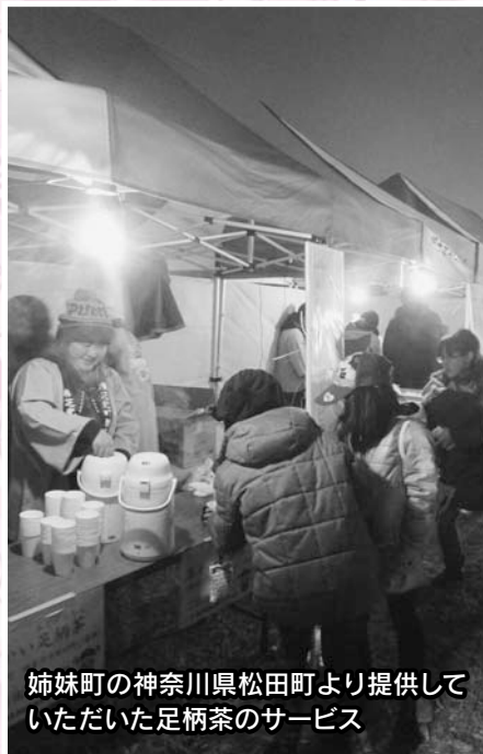
姉妹町の神奈川県松田町より提供していただいた足柄茶のサービス