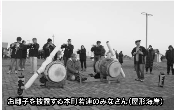
お囃子を披露する本町若連のみなさん(屋形海岸)

元日の早朝、観光まちづくり協会主催の初日の出イベントが屋形海岸と木戸浜海岸で開催されました。 屋形海岸は甘酒とお茶が、木戸浜海岸ではお汁粉とお茶が振る舞われたほか、両海岸では紅白もちの無料配布も行われました。 また、4年前から提供していただいている姉妹町の神奈川県松田町の足柄茶も寒さの中で大変好評でした。 当日は天候にも恵まれ、両海岸には合わせて約3,100人が訪れ、太平洋から昇る雄大な初日の出で新年のスタートを祝いました。