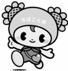
ちばこくほマスケットキャラクター「ちーこちゃん」